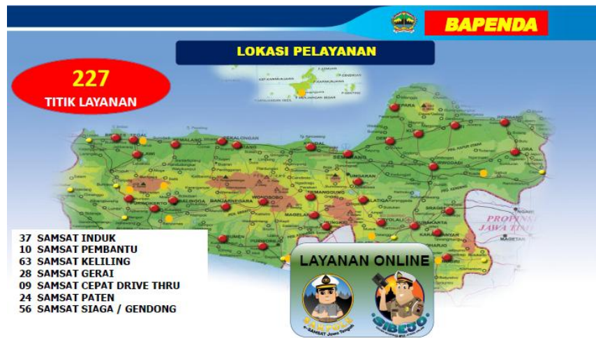
Gambar 2. Lokasi Layanan Samsat di Jawa Tengah