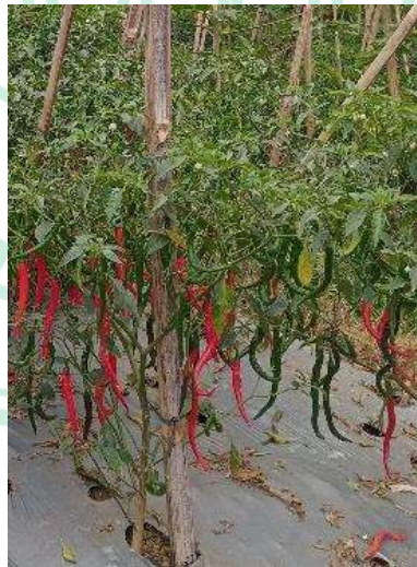
Gambar 2.1 Cabai Merah Keriting