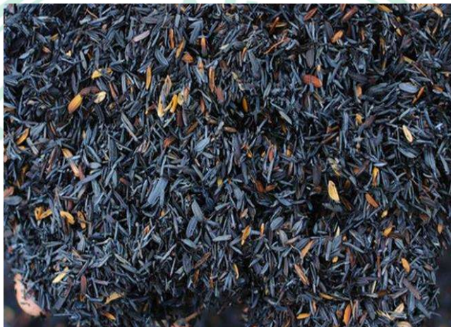
Gambar 2.3 Arang Sekam

mengandung garam-garam yang dapat mempengaruhi pertumbuhan tanaman (Nasir, 2022). Arang sekam dapat digunakan sebagai media tanam karena terdapat kandungan unsur hara yang dibutuhkan tanaman. Selain itu arang sekam dapat meningkatkan porositas tanah dan memperbaiki kondisi tanah sehingga menyerap air. Arang sekam memiliki pH yang cukup tinggi sehingga dapat menetralkan pH tanah asam. Namun komposisi arang sekam yang terlalu banyak pada media tanam dapat menghambat pertumbuhan tinggi tanaman cabai (Nule, et al. 2021). Berikut gambar arang sekam yang di gunakan untuk media tanam.