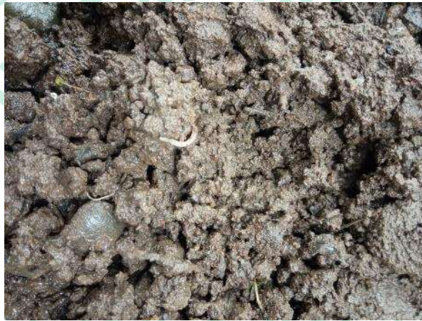
Gambar 2.2 Tanah Media Tanam

meningkatkan daya tahan terhadap penyakit dan hama, serta mendukung transportasi hasil fotosintesis dalam tanaman. Fosfor berfungsi mempercepat pertumbuhan dan perkembangan akar, mendukung pembungaan serta pematangan buah (Maulidan dan Putra 2024). Nitrogen (N) sangat berperan dalam pembentukan protein, klorofil, dan pertumbuhan vegetatif tanaman. Kalsium (Ca) dan Magnesium (Mg) juga berperan dalam pembentukan dinding sel dan fotosintesis, di mana Kalsium berfungsi memperkuat dinding sel dan Magnesium adalah pusat molekul klorofil yang vital dalam proses fotosintesis (Purba, et al. 2021). Berikut gambar tanah yang di gunakan untuk media tanam.